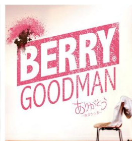
ベリーグッドマン